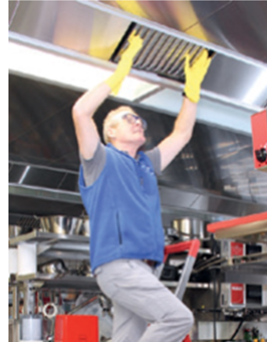
Immagine: CSFL 6207

Ogni anno, più di 10 persone muoiono durante i lavori di manutenzione di macchine e impianti.