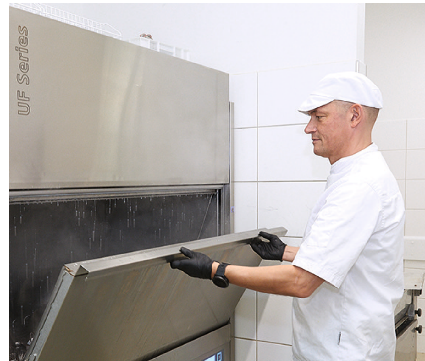
Immagine: CSFL 6207